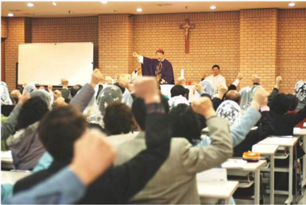
2006년 수원교구 소공동체 위원회장 모임사진

천주교 산호세 한국 순교자 성당 구역사목부 2008년 제 1차 워크샵 준비팀